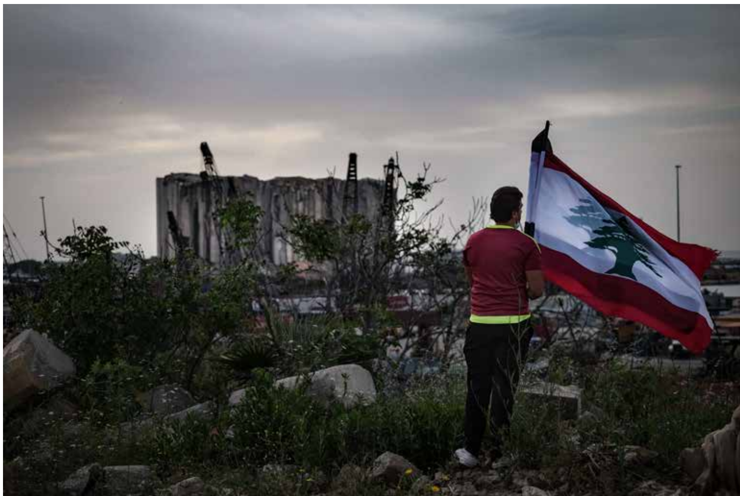
Un homme brandit un drapeau libanais devant les silos à grains du port de Beyrouth.