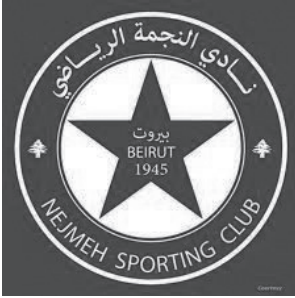
شعار نادي النجمة

أما طائفيًا فإنّ تقسيم الأندية الكرويّة هو على النحو التالي: الأرمن لهم خمسة أندية، الدروز ٢٣ ناديًا، السنّة ٦٨ ناديًا، والأندية المسيحيّة ٣٧، أمّا الحصة الأكبر فهي للشبيعة بـ٧١.