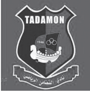
شعار «التضامن صور»

تعود فكرةُ تأسيسِ نادٍ رياضي في مدينة صور إلى عام ١٩٣٩، حيث بدأ بعضُ طلابِ المدارس بمزاولة لعبة كرة القدم في شوارع المدينة وساحاتها. (٤) وعام ١٩٤٦ اجتمع بعضُ هؤلاء وكونوا فريقًا لكرة القدم وتقدّموا بطلبٍ إلى الاتحاد اللبناني تحت اسم «فريق