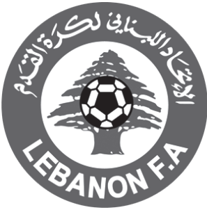
شعار الاتحاد اللبناني لكرة القدم