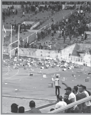
من نتائج اشكال جمهوري النجمة والعهد علي ملعب المدينة الرياضية

احتدامَ المنافسة بين «النَّجْمَة» و«العهد» هو بين جمهورين يغلبُ عليهما الطابعُ الشيعي، وصارت المواجهاتُ بينهما أشبهَ بمعاركٍ تنتقلُ إلى جمهوريّهما عبر الهتافاتِ، وأحياناً تتفاقمُ لتُصبحَ اشتباكاتٍ فعليّةً بين المشجّعين، أو بينهم واللاعبين. ففي عام ٢٠١٣ اقتحم جمهور «النَّجْمَة» الملعب ليعتدي على رياضيي «العهد» فتدخلت القوى الأمنيّة لاحتواء الموقف. (٢٥)