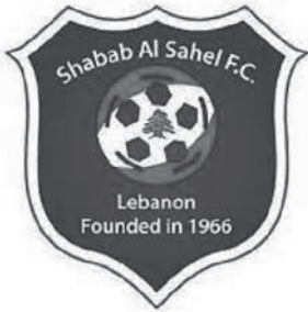
شعار شباب الساحل

على شاكله النوادي الشيعيّة التي أسلفنا ذكّرها، بادرت مجموعةُ شبانٍ شيعيّة (١) من أهالي بلدة حارة حريك بتأسيس فريقٍ كروي، وتمّ التوافقُ على إطلاقِ تسمية الساحل، نسبةً إلى ساحلِ المتن الجنوبي، على الفريق الناشئ الذي جمَعَ لاعبينٍ من حارة حريك والغبيري.