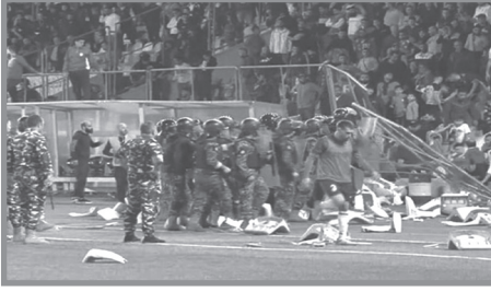
إشكال العهد والانصار ١٢ آذار ٢٠٢٣

شدّ مشجّعو «النّجمة» عن القاعدة التي تقول بأنّ الانتماء الكروي في لبنان يخضع للمعايير الطائفية - المناطقية التي بُنيت عليها السياسات والانقسامات في البلاد، وذلك في إبقائه