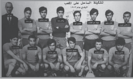
نادي شباب الساحل عام ١٩٧٢

قضى العمرانُ على الملعب بعد إنشاء ثانوية المصطفى على أرضه، انتقل الفريقُ إلى ملعب «الإخاء» حارة حريك. (١٦)