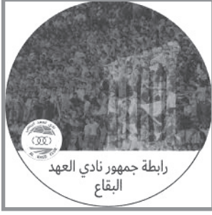
رابطة جمهور نادي العهد في البقاع

على مختلف الأراضي اللبنانية (٤٣) وإلى النشاطات الكروية والرياضية التي تقوم بها أكاديمياته، فإنها دوماً حاضرة (٤٤) في إحياء المناسبات ذات الطابع الديني أو الشيعي خصوصاً، كعاشوراء أو أربعينية الإمام الحسين. وفي تموز ٢٠٢٢ أطلق النادي أكاديميةً رياضيةً في منطقة