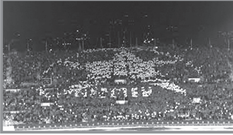
جمهور «النّجمة» في مباراة الفريق أمام «الأهلي المصري» في البطولة العربية ٢٠١٨

ثمّة علامة فارقة في كرة القدم اللبنانيّة تتمثّل بنادي «النّجمة»، ذلك أنّ «جمهوره العام الغالب من الطائفة الشيعيّة، حيث إنّ شيعه بيروت والضّاحية الجنوبيّة والجنوب والبقاع