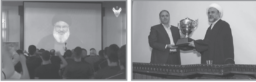
نادي العهد يسلم كأس البطولة الى ممثل أمين عام حزب الله حسن نصرالله الشيخ نبيل قاووق، في حضور نصر الله من خلال الشاشة

وفي كل الأحوال، يرتبط النادي بعلاقاتٍ وثيقة بالحزب، رغم عدم تبني الأخير له رسميًا، إلا أنَّ العضدَ المعنوي موجودٌ دائمًا، وسابقًا كان الدعم المادي متاحًا، وهو يأتي راهنًا من مصادر مختلفة. ويظهر التقاربُ في استخدام اللون الأصفر على غرار راية الحزب، وفي تقديم الكأس لأمينه العام السيد حسن نصر الله في كلِّ مرة، (٤٢) أو لضريح عماد مغنية. (١)