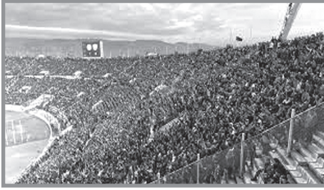
جمهور «نادي النجمة»

ولئن كرة القدم لعبةً شعبيةً يتابعها الفقراء، وهؤلاء بغالبيتهم في المناطق الشعبية وضواحي العاصمة كانوا من الشيعة، «ففي تلك الفترة كانت العاصمة اللبنانية تشهد