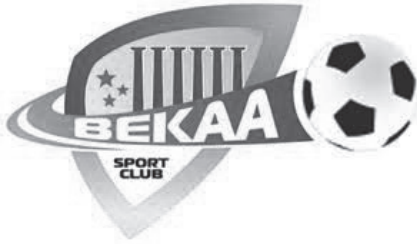
شعار النبي شيت

خلال ٢٠١٢ تمَّ شراء نادي «ناصر الرياضي» في برّ إلياس وتحويل اسمه إلى نادي «النبي شيت» ونُقِلَ مركَزُه من برّ إلياس بقضاء