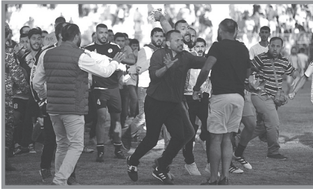
جمهور «العهد» يجتاح ملعب صيدا البلدي خلال إشكال حصل في مباراة نصف نهائي كأس لبنان ٢٠١٨ أمام نادي «الإخاء الأهلي عاليه»

ويظهر التأثير السياسي والديني من الهتافات خلال المباريات. ويذكرُ بأنّ جمهور «العهد» أطلق في مباراة نهائي الكأس في أيار ٢٠١٩ أمام «الأنصار»، وبقصد الاستفزاز، هتافاتٍ داعمةً للرئيس السوري بشار الأسد. (٤) كما تكرر ذلك في ١٢ آذار ٢٠٢٣ أثناء المباراة النهائية لتحديد بطل الدوري بين «العهد» و«الأنصار» ووقعت أعمال شغبٍ من قبل جمهور الثاني اعتراضاً على إلغاء الحكم هدفاً لفريقهم، فأوقفت المباراة ولم تُستكمل، وصدرت عن مؤيدي الأول هتافاتٍ «الله، سوريا، بشار وبس». ويذكرُ أنّ مدرب «العهد» هو السوري رأفت محمد، وقد شوهد يتفاعل مع تلك الشعارات بحماسة. (٥)