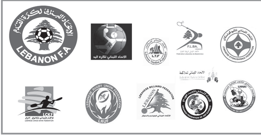
الاتحادات الرياضية في لبنان «اتحادات الشّعبة»

الركبي يونيون، (I) البلياردو، الكيو كوشنكاي، (II) الجيت كون دو، (III) والأم أم أي (IV) واتحاد المعوقين. (5) وتتألف اللجنة الأولمبية اللبنانية من ١٤ عضوًا، ٧ للمسلمين (٤ سنّة ٣ شيعة) و٧ للمسيحيين بينهم الرئيس، (٦) أمّا أحد نوابه، الذي هو عادة رئيس اتحاد كرة القدم، فيكون بالعرفِ شيعيًا.