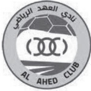
شعار نادي العهد