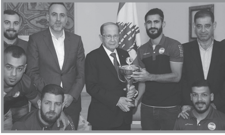
العهد يهدي كأس الإتحاد الآسيوي الى رئيس الجمهورية السابق ميشال عون

وعمومًا فإنّ الهتافات بين جمهوريّ الفريقين تأخذُ طابعَ المزايدة بشأنِ التقرب من الأمين العام الحالي للحزب السيّد حسن نصرالله، فيهتف النجماويون مثلًا: «نجماوي نجماوي السيد حسن نجماوي»، ليُردّ عليهم بأنّه عهداوي. (٦) وكان جواد، نجل نصر الله، قال في مقابلة معه إنّ والده يشجّع «العهد» منذ عُرف بـ«نجمة العهد الجديد» حتى اليوم. (٧)