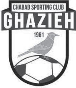
شعار الشباب الغازية

أغلبية أعضاء الجمعية والنادي من أبناء مدينة الغازية، لكن لابعيه هم من مختلف المناطق اللبنانية.