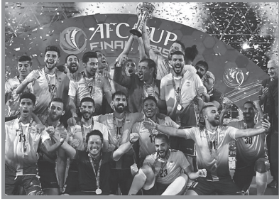
العهد بطلاً لكأس الإتحاد الآسيوي

عام ٢٠٠٨ حَقَّقَ النادي لقبَ الدَّوري للمرة الأولى في تاريخه، (٣٨) ومن حينها تمكَّن من الفوز بالبطولة تسعَ مرَّات، كما غنمَ كل الكؤوس الممكنة، كأس لبنان (I) وكأس النخبة والسُّوبر، (II) وبات أول فريق لبناني يحقِّق ثلاثيَّة ورباعيَّة محليَّة. (III)